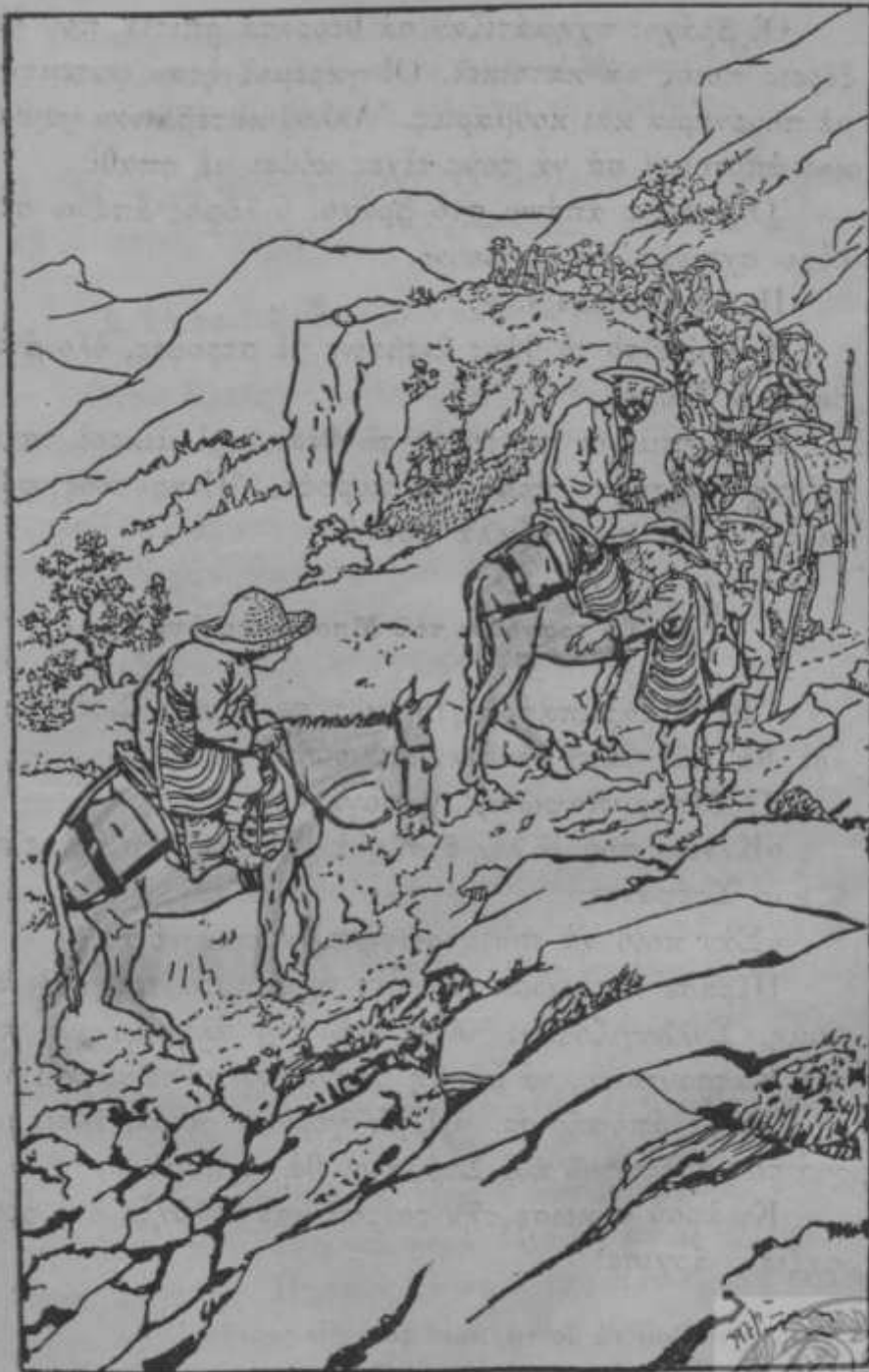
Πάνε στα ψηλά βουνά.